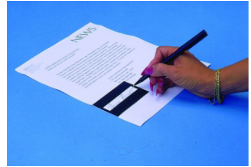
Figura 3: Guía para firma